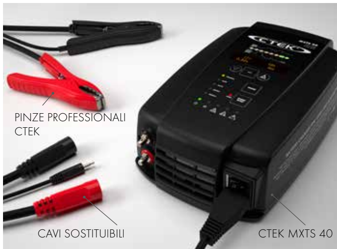
PINZE PROFESSIONALI CTEK